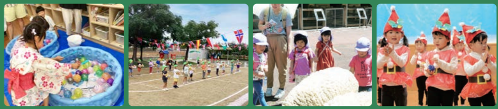
夏のお楽しみ会 親子ふれあい運動 遠足 クリスマス会